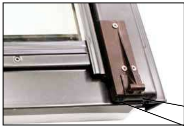
Abb. 4 (1x li ./ re.) (3x 3,9 x 16)