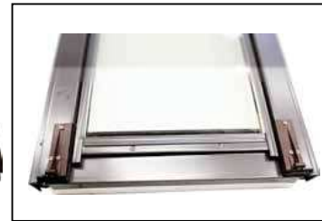
Abb. 5 (1x li ./ re.) (3x 3,9 x 19)